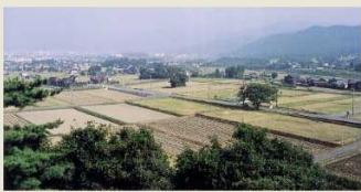
▲藤原利仁跡跡伝承地 敦賀市御名

芥川龍之介の小説『芋粥』の題材になった話が、『今昔物語集』巻26にあります。その主人公藤原利仁は、北国武士団の始祖的な人物ですが、若いころ「一人」(撰聞の意、関白藤原基経か)に仕え、敦賀の豪族有仁の嫡となり、越前に住んでいました。そして同僚の五位の侍が薯蕷粥(山芋の粥)を飽きるほど食べたいというので、敦賀の家に連れて行き、大量に粥を作らせたところ、五位の侍は見ただけで飽き飽きして食べられなかったという話です。