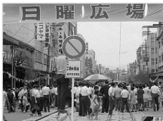
▲日曜広場 昭和45年 64680