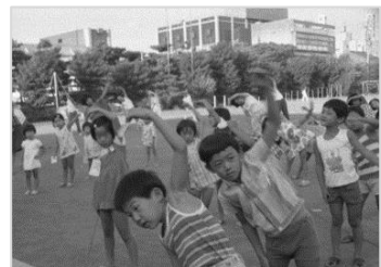
▲順化ラジオ体操 昭和48年 66597